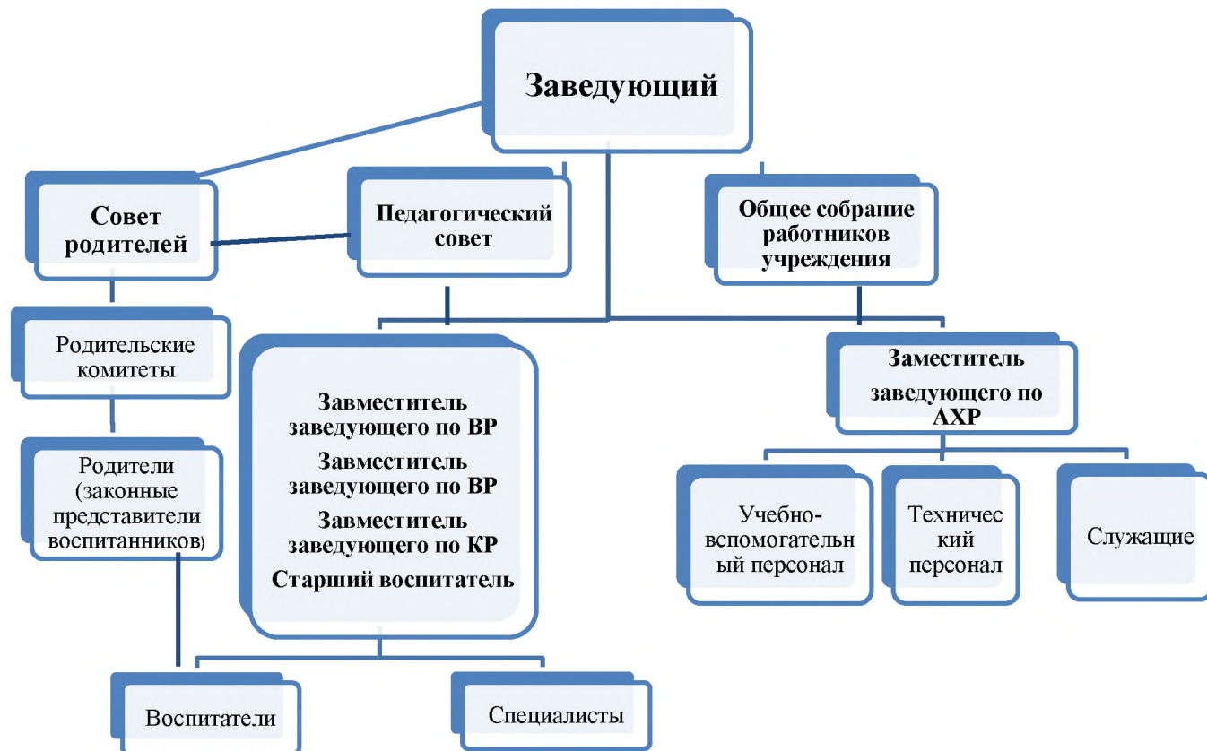
Схема управления образовательным учреждением

Вывод: Муниципальное бюджетное дошкольное образовательное учреждение «Образовательный комплекс - детский сад № 201» осуществляет свою деятельность в соответствии с целями и задачами, определенными законодательством РФ в сфере образования и Уставом МБДОУ № 201, путем выполнения работ и оказания услуг. Деятельность дошкольной образовательной организации строится с учетом мотивированного мнения работников учреждения, а также мнения родителей (законных представителей) обучающихся.